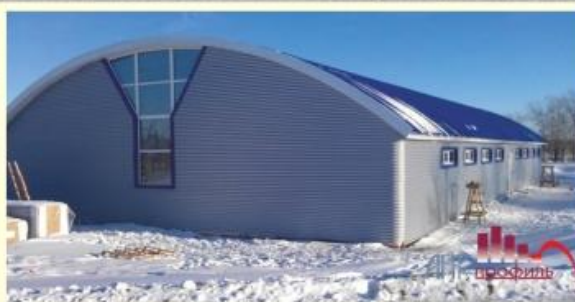
Ангар прямостенный с арочной кровлей