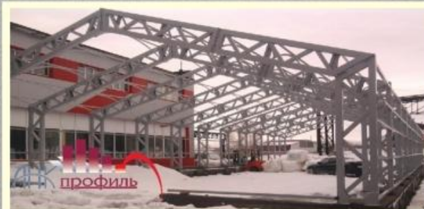
Ангар прямостенный с односкатной и двускатной кровлей